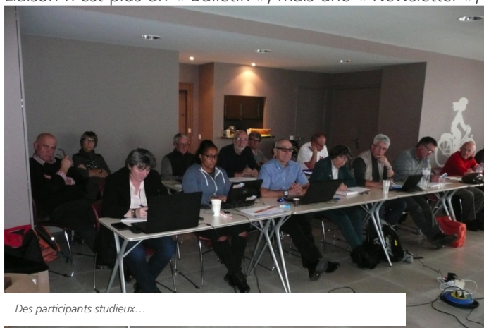
Des participants studieux...

Liaison n'est plus un « Bulletin », mais une « Newsletter », et sa nouvelle forme a pu dérouter. Cependant, si elle peut de prime abord apparaître comme malcommode pour une lecture complète, le fait que les différents articles sont classés sur le site dans la rubrique adéquate de la « gestion documentaire », de la façon la plus explicite possible, permet ensuite de les retrouver facilement : le site devient ainsi, non seulement un moyen indispensable pour actualiser les documents, mais également une « bibliothèque ressource de l'éducateur » qui se crée peu à peu.